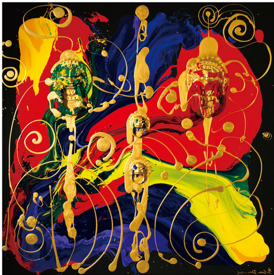
1 《大将门 2014 / 大帝图》 复合媒材 200 × 200 cm 2 《大将门 2014 / 王者宝座》 复合媒材 130 × 160 cm 3 “大将门”系列创作结合古董铜门环，并善于 颜色搭配、结构组合与层次表现。

充满工艺与文化意义的古董，将这些百年岁月的收藏品融合西方油彩，在奔放华丽中展现东西合璧之美，延续了中国传统工艺精品生命，更开创出东方当代艺术崭新风格”。全球知名超跑汽车厂商总裁就是深受“大将门”创作吸引，而邀请李善单跨界合作。