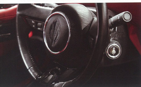
鮮紅與深黑的強烈配色，讓這車能發出最野的東方氣息。